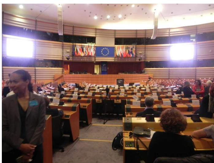
Parlamentul European, deschiderea anului universitar, 2018