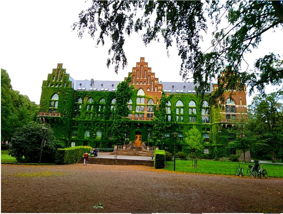
Universitatea din Lund, exterior