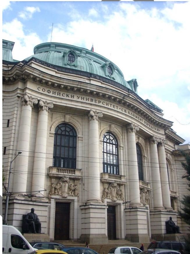
Universitatea din Sofia, fațadă