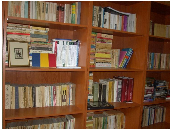
Biblioteca Lectoratului din Sofia