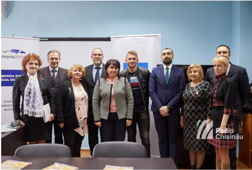
Lectoratul de Limbă Română din Comrat