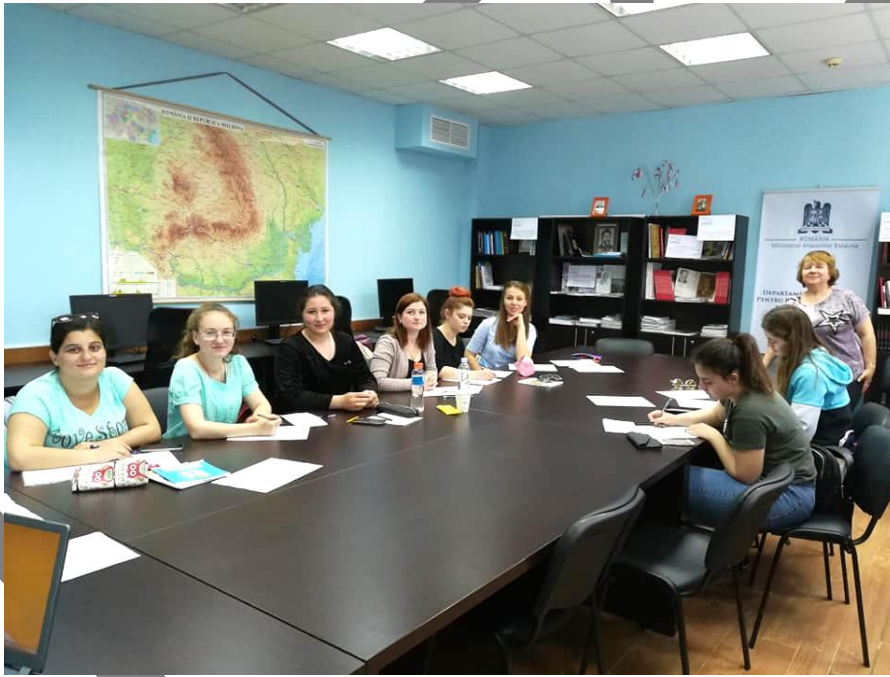
Lectoratul de Limbă Română din Comrat